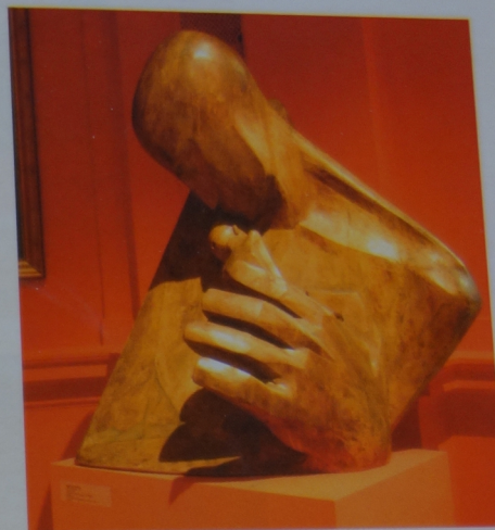
Xawery Dunikowski Tchnienie , 1903