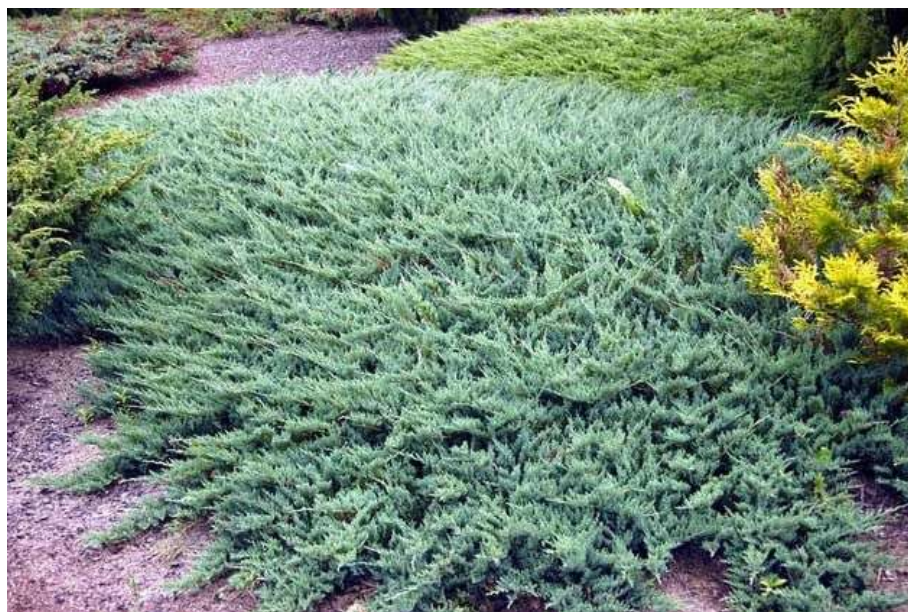
jałowiec płożący 'Blue Chip'